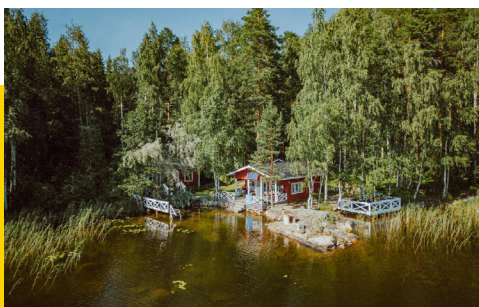
Etelä-Savo on kestävä mökkeilyn maakunta. Vinkit vapaa-ajan asukkaalle laiturilla.fi.

MAAKUNTASTRATEGIA + MIKKELIN KAUPUNGIN STRATEGIA 2022-25 + MIKSEIMIKKELIN STRATEGIA