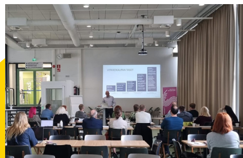
Eteläsavolaiset yritykset kehittävät aktiivisesti digitaalisen liiketoiminnan taitoja. Tutustu digiportaati.fi