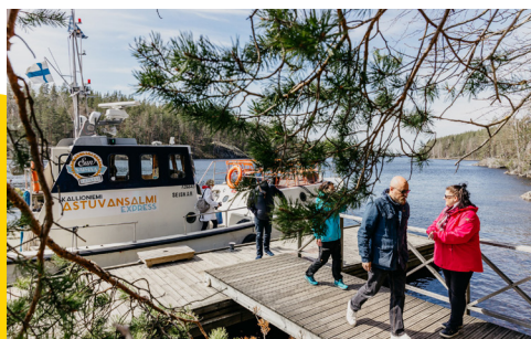
Luonto- ja matkailukohteiden saavutettavuus parani Hop On Hop Off -laiva- ja bussiretkillä.

Kaupungin ja yhtiön välinen palvelusopimus vuosille 2024-2027 hyväksyttiin kaupunginhallituksen kokouksessa 5.2.2024. Nelivuotinen sopimus antaa yhtiölle mahdollisuuden pitkäjänteiseen oman toiminnan kehittämiseen.