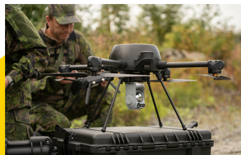
Maanpuolustusjärjestöjen drone-hanke sai 600 000 euron tuen Wihurin rahastolta.