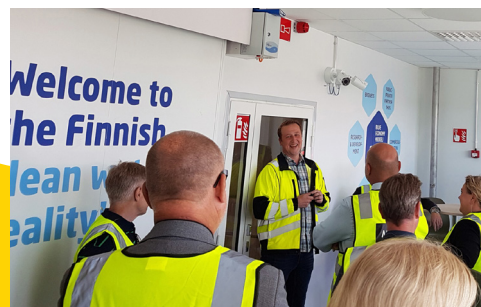
Kaupunkilaisilla oli mahdollisuus tutustua jätevedenpuhdistamoon Mikkelin syntymäpäiväviikolla.