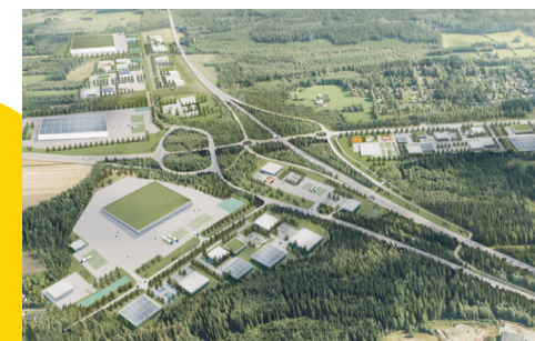
Mikkelin kaupunki ja Neoen Renewables Finland Oy solmivat vuokrasopimuksen.